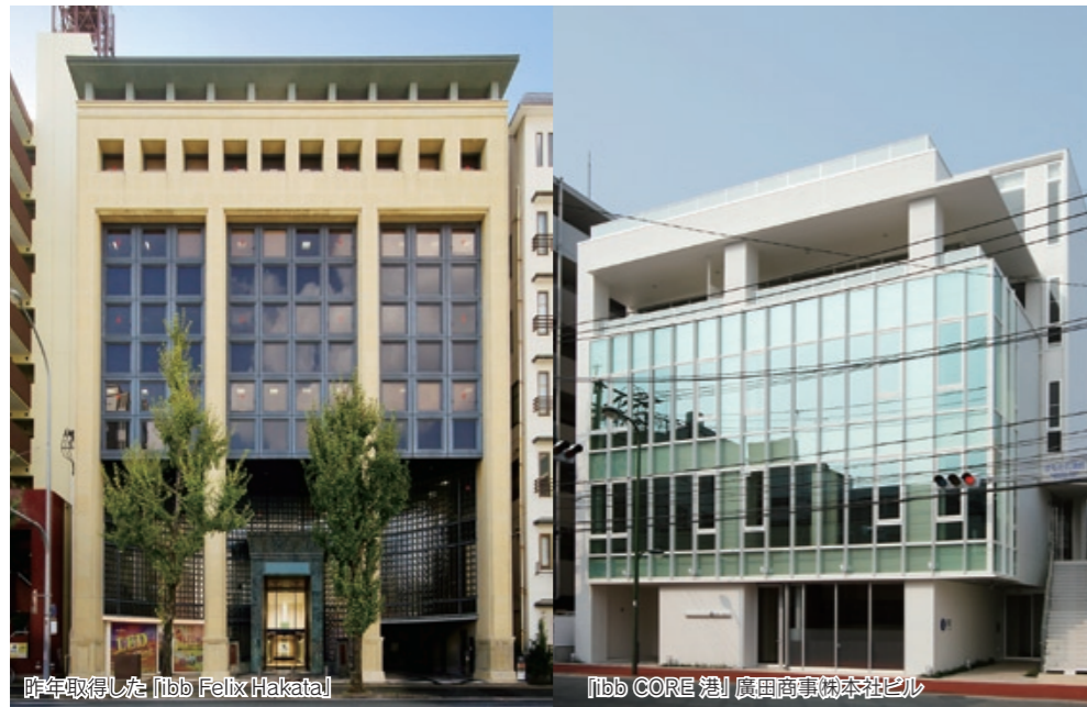
昨年取得した「ibb Felix Hakata」