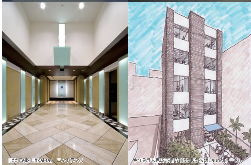
「ibb Felix Hakata」 エントランス