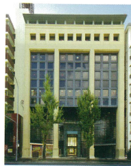
オフィスビル「ibb Felix Hakata」