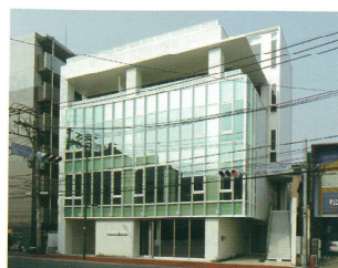
「ibb CORE港」廣田商事株本社ビル

起業やSOHO支援など時代を先取りした高付加価値物件ibbシリーズを生み出してきた廣田商事(株)。